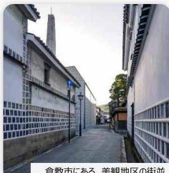
倉敷市にある、美観地区の街並