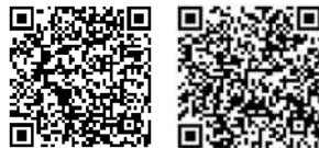
マイナビ2022 リクナビ2022